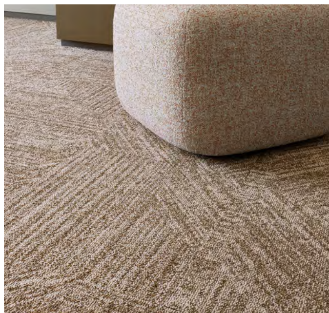
Tessera topology bronze arc