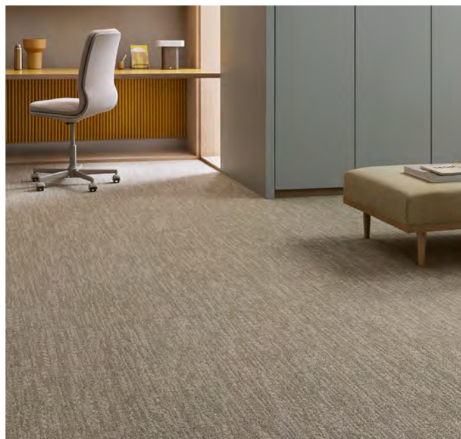
Tessera twine khaki knot