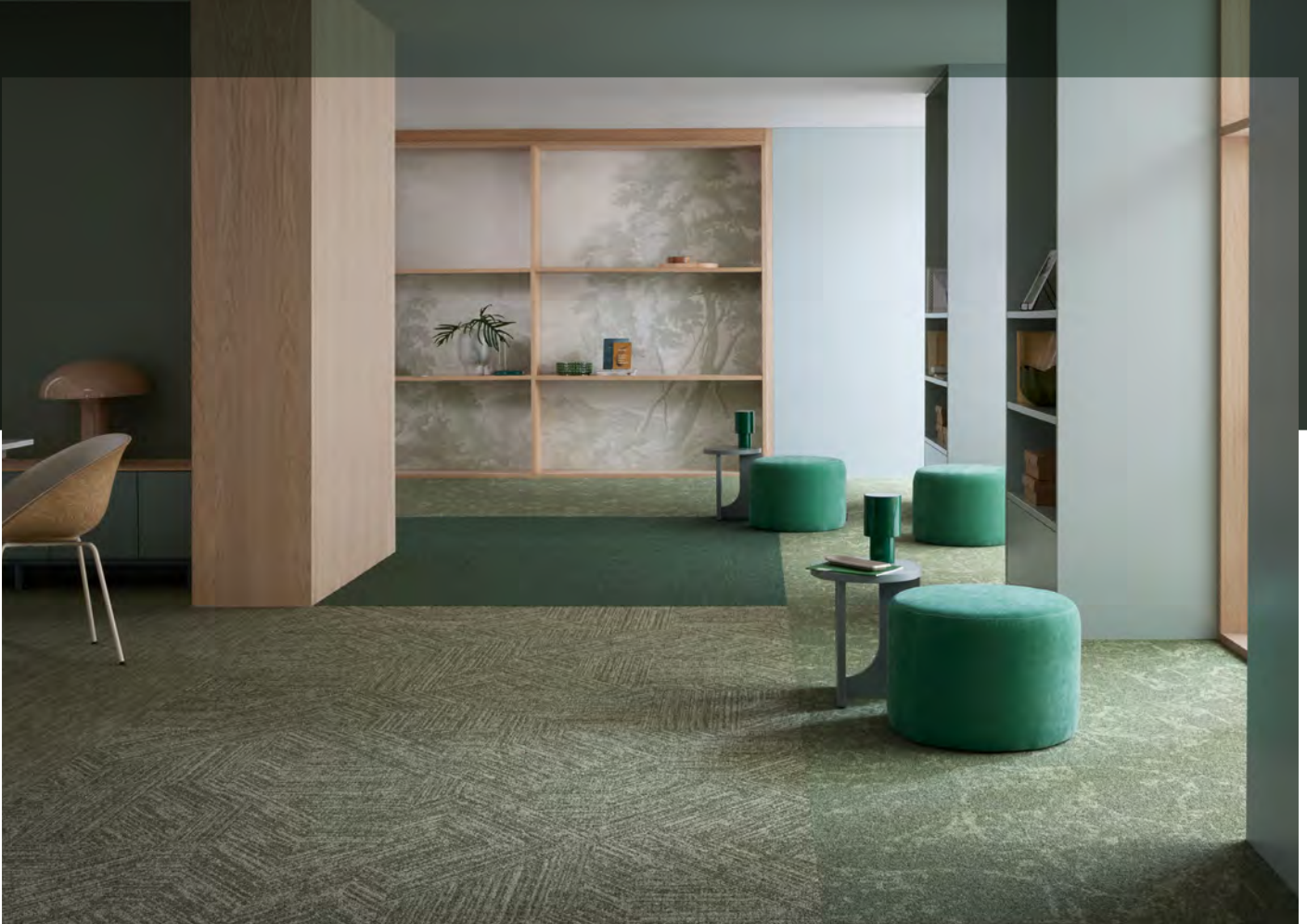
Tessera tranquillity chilled chive, chroma ivy, twine wasabi weave et topology mossy base