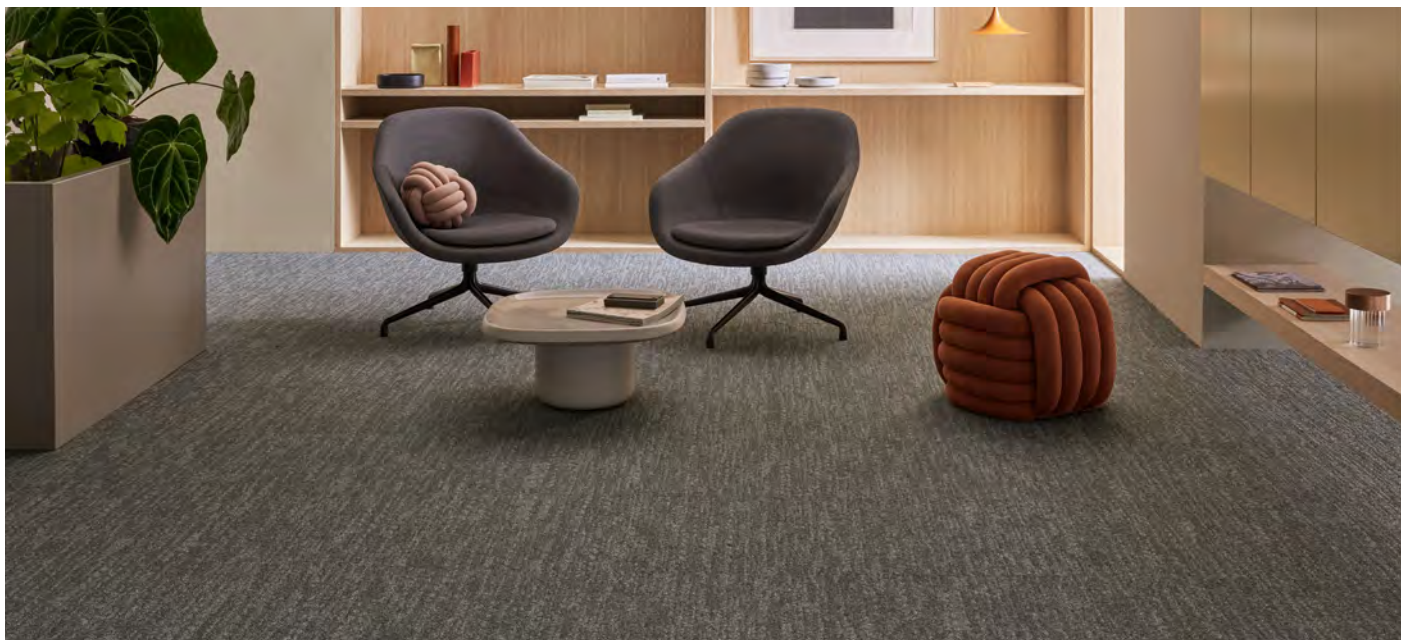
Tessera twine granite grid